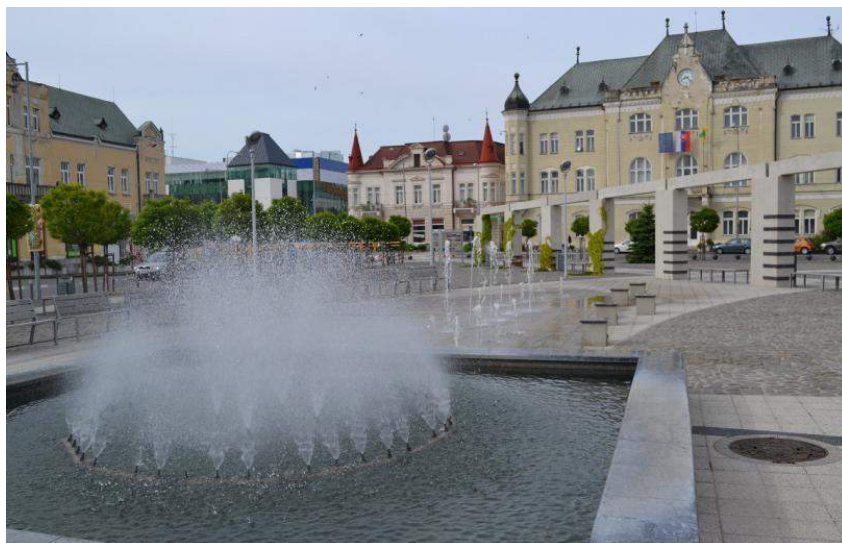
Súčasná podoba mesta Levice.

Prvá písomná zmienka mesta Levíc pochádza z roku 1156, v ktorej sa píše o tom ako arcibiskup z Ostrihomu posvätil faru v dedine Bratka, ku ktorej pričlenili obec Leua (Levice). Dominantou Levíc je aj Levický hrad, ktorý bol postavený v 13. storočí. Hrad a jeho pevnosť neslúžili však na ochranu Leua (Levíc), ale na ochranu stredoslovenských banských miest, ktoré boli od počiatku existencie veľmi unikátnym a špeciálnym