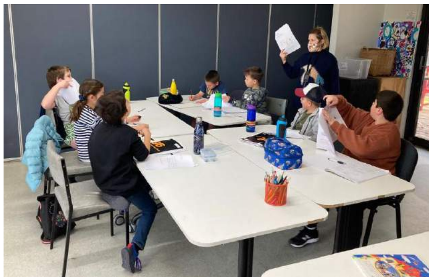
Z vyučovania naživo sme sa tešili, netrvalo však dlho. Znovu sme sa presunuli do online priestoru.

Tretí štvrtrok sa nesie v znamení tém o ľudskom tele a zdravej životospráve. Pani učiteľky sa snažia zaujať deti ich prípravami a motivovať ich tak k rozprávaniu, či už prostredníctvom pesničiek, básničiek, rôznych zaujímavých pracovných listov alebo prezentácií.