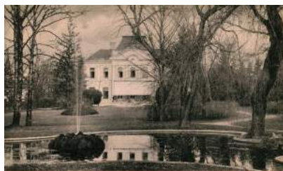
Schoellerov park kedysi a dnes.

Pred prvou Československou republikou, sa o rozvoj mesta zaslúžili najmä bohaté meštianske rodiny. Rozvoju mesta pomohla aj domáca odevná výroba a vybudovanie továrne, či otvorenie nového secesného Hotela Lev. Hotel Lev je aj naďalej dominantou mestského centra. Okrem ubytovania a reštaurácie sa tam nachádzala aj spoločenská miestnosť, kde sa Levičania chodili každú Sobotu zabávať. Rodina Schoellerovcov sa zaslúžila o skutočne rozsiahly rozvoj mesta. Levické panstvo odkúpili od Estherházyovcov a Leviciam dali novú tvár. Medzi hlavné záľuby rodiny patrilo poľovníctvo, preto aj v meste dali postaviť poľovnícku chatu Pate, ktorá mala nádhernú mestskú záhradu. Rovnako podporovali spolky, mali patronáty nad niekoľkými organizáciami a farami. Medzi ich hlavné úlohy v rámci patronátu patrilo napríklad