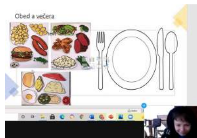
Preberali sme aj tému zdravej životosprávy.