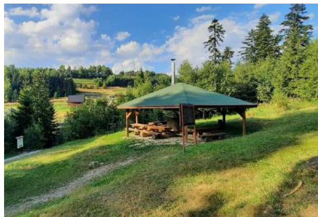
Návštevníci Trojmedzia si môžu oddýchnuť v altánku.

Hoci obyvatelia každej z obcí hovoria iným jazykom, spája ich goralské nárečie i množstvo podujatí, ktoré sa na Trojmedzí konajú. Športovcov stretnete na turistickom pochode cez Tri štáty Európy či na Goralskom maratóne, veriaci sa zúčastňujú spoločnej eucharistie slávanej biskupmi z troch diecéz, pohodu a zábavu tu zažijete napríklad pri stavaní mája či slávení Silvestra. Labužníkov poteší najmä česká obec Hřčava, ktorá priamo na Trojmedzí disponuje miestnou Syrárnou či neďalekou útulnou kaviarňou Hospůdka na Vyhliďce.