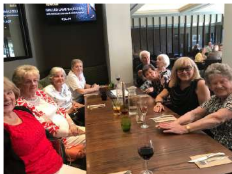
Stretnutie sa nieslo v príjemnom duchu.

V nedeľu 28. februára 2021 sa stretli naši seniory a členovia výboru na tradičnom obede, ktorý sa tradične koná v auguste. Keďže pandémia prerušila všetky naše