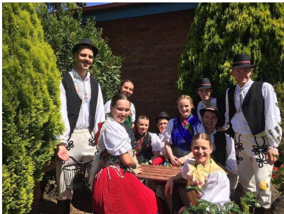
Liptár - folklórna skupina pri SSLŠ v Lavertone.

kolektive hovorí aj vysoká účasť na schôdzach výboru.