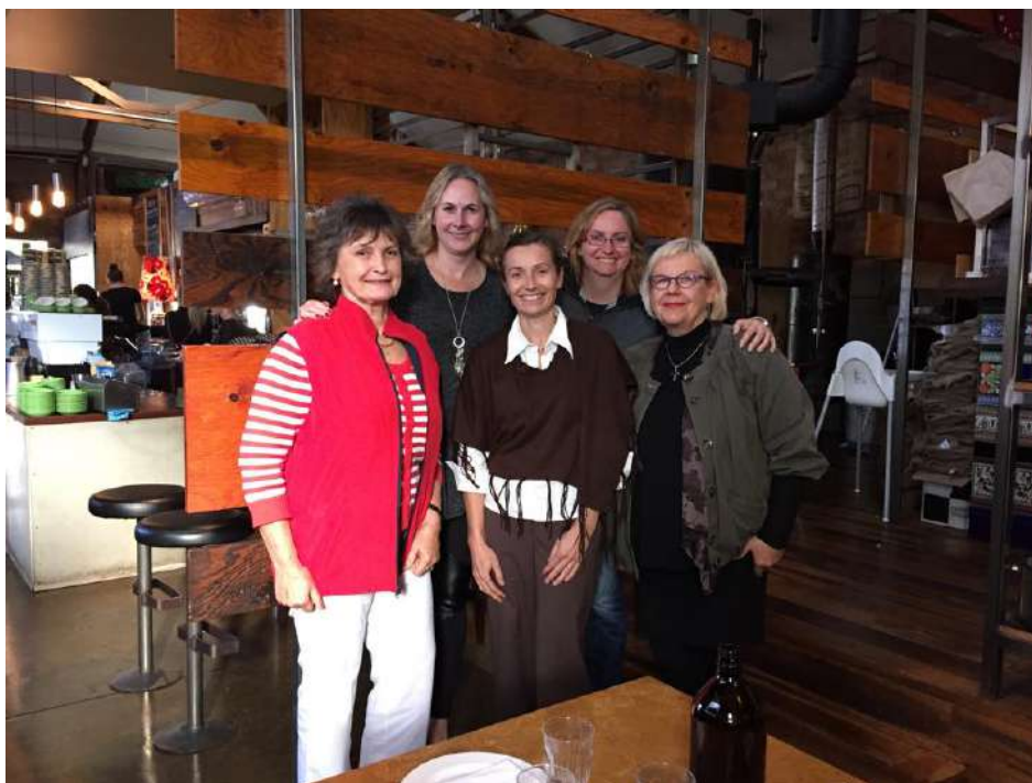
Úzka spolupráca medzi krajskými organizáciami - G9.