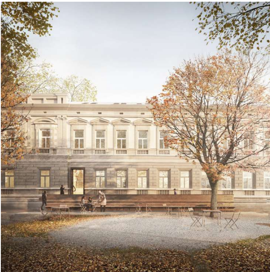
Plán rekonštrukcie obsahuje park, modernú knižnicu aj spoločné priestory.

Plán je zachovať historické s modernými črtami a zariadením. Celková rekonštrukcia bude stáť približne 14 miliónov Eur. Unikátny bude aj ekologický spôsob získania teplej vody,