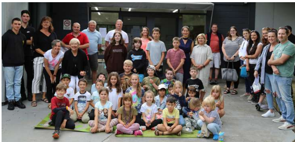
Slovenská detská beseda 2021. Sme radi, že sme opäť spolu!

Po necelom roku online vyučovania na diaľku v 2020, sme sa 30.1.2021 stretli v našej škole v krásnom prostredí v Central Gardens Hawthorn. Je ťažko opísať rozžiarené tváre rodičov a hlavne detí, ktoré sa nevideli, v niektorých prípadoch, celý rok. Neisté pohľady nových rodičov a detí sa veľmi rýchlo rozplynuli po úprimnom privítaní a zoznámení sa s našou školskou komunitou. Neskôr, pri šálke kávy a občerstvení, sa nadväzovali nové priateľstvá.