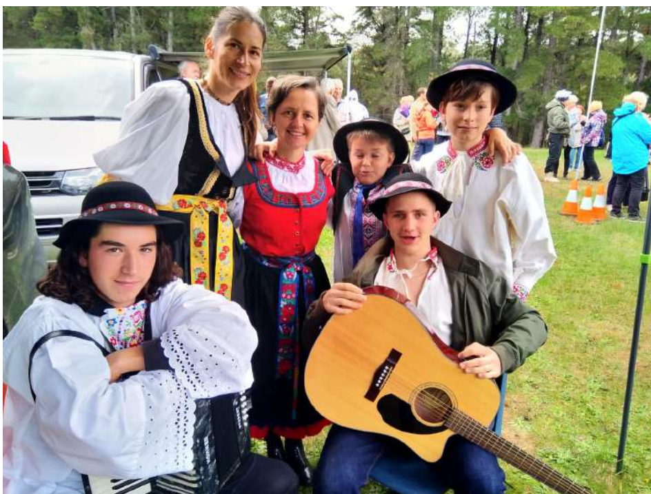
Stavenie mája na Šumave je jednou z obľúbených akcií.

V Melbourne, ako podotkol člen výboru združenia, sa darí krajskému životu aj preto, lebo sa nehádame. Trochu zjednodušene, ale pravdivo. Určite to nie je vždy ideálne, ale keď vidíme význam a dopad organizovaných akcií, všetky vrásky sa vyhladia a spoločne sa tešíme dobrému výsledku. O dobrom