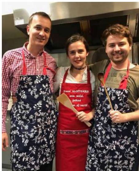
Mladí kuchári z výboru krajskej komunity.