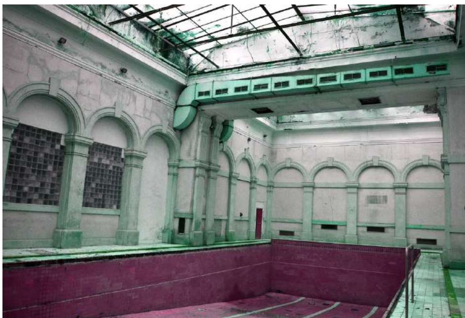
S hlavným bazénom sa po rekonštrukcii počíta ako s hlavným klenotom kúpeľov.

Plán obsahuje novú modernú knižnicu, park aj spoločné miestnosti. Zachová sa pôvodný hlavný bazén, ktorý bude tvoriť klenot historického pôvodu týchto kúpeľov. Priestory kúpeľov by mali byť otvorené pre širokú verejnosť, dostupné pre každého.