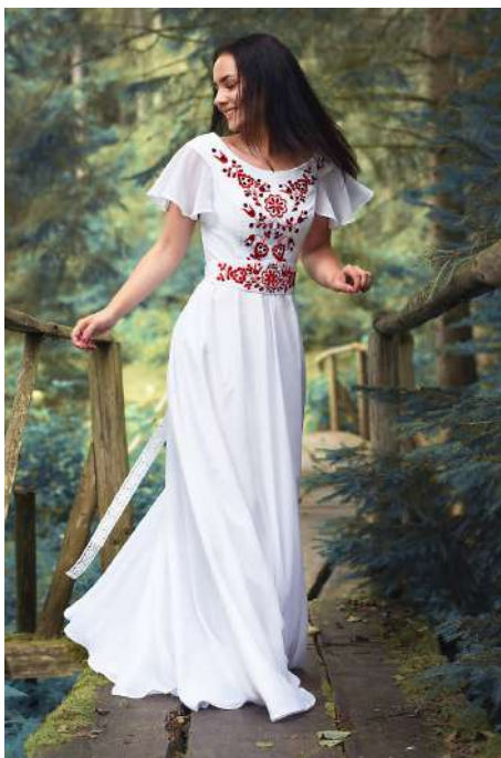
Svadobné šaty značky Folková.